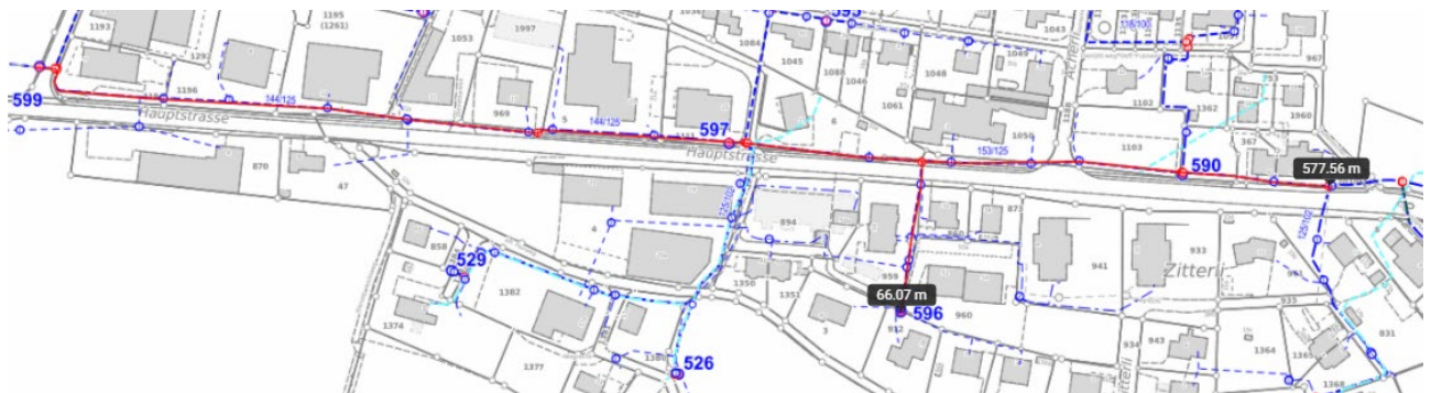
Abb. 1: Übersichtsplan des Trinkwasserversorgungsnetz in Alterswil im betroffenen Abschnitt:

Die jüngsten Abklärungen hinsichtlich des Zustands der Trinkwasserleitung, welche parallel zur Kantonstrasse im Projektperimeter verläuft, haben ergeben, dass nicht nur punktuelle Reparaturen ausreichen, sondern einen grosszügigen Ersatz der Leitung in Betracht gezogen werden muss. Auch wenn die Leitung nicht unmittelbar unter der heutigen oder projektierten Kantonstrasse verläuft, soll die Sanierung bzw. der Ersatz vorgenommen werden.