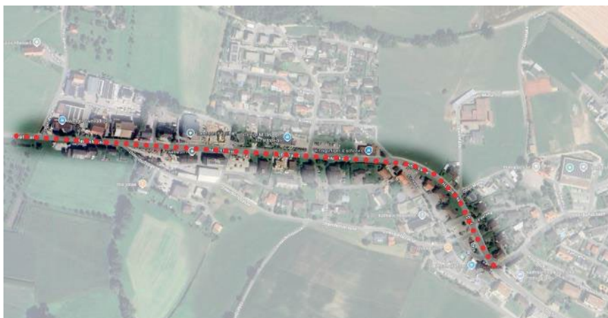
Abb. 2: Projektperimeter